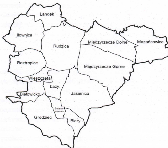
Mapa Gminy Jasienica z podziałem na sołectwa

Gmina Jasienica ma obszar 91,714 km 2 , w tym: użytki rolne 60,41% oraz użytki leśne 16%. Gmina stanowi ok. 20% powierzchni powiatu bielskiego (powierzchnia powiatu – 459 km 2 ). Gmina Jasienica położona jest na Pogórzu Śląskim. Zróżnicowana rzeźba cechuje zwłaszcza sołectwa Rudzica, Międzyrzecze Górne, Mazańcowice, Łazy i Wieszczęta. Landek i Hłownica leżą na obszarze Kotliny Oświęcimskiej oraz na granicy Doliny Wisły i Wysoczyzny Międzyrzeczkiej. Charakteryzuje je płaska rzeźba terenu z licznymi stawami rybnymi. Kompleksy stawów rybnych, stanowią łączną powierzchnię około 460 ha – występują w sołectwach: Hłownica, Jasienica, Landek, Roztropice, Międzyrzecze Górne i Dolne. Obszar gminy pokryty jest siecią 13 potoków o łącznej długości 65,1 km. W zróżnicowanym terenie Gminy przeważa zatem obszar wyżynny, złożony z łagodnych i szerokich wzgórz położonych na wysokości 260-430 m n.p.m. Bliskość atrakcyjnych terenów turystycznych i historycznych jest dodatkowym atutem Gminy wpływającym na rozwój usług w zakresie obsługi ruchu turystycznego, tworzenia bazy noclegowo – gastronomicznej oraz form rekreacji w oparciu o walory samej gminy. Dwa obszary