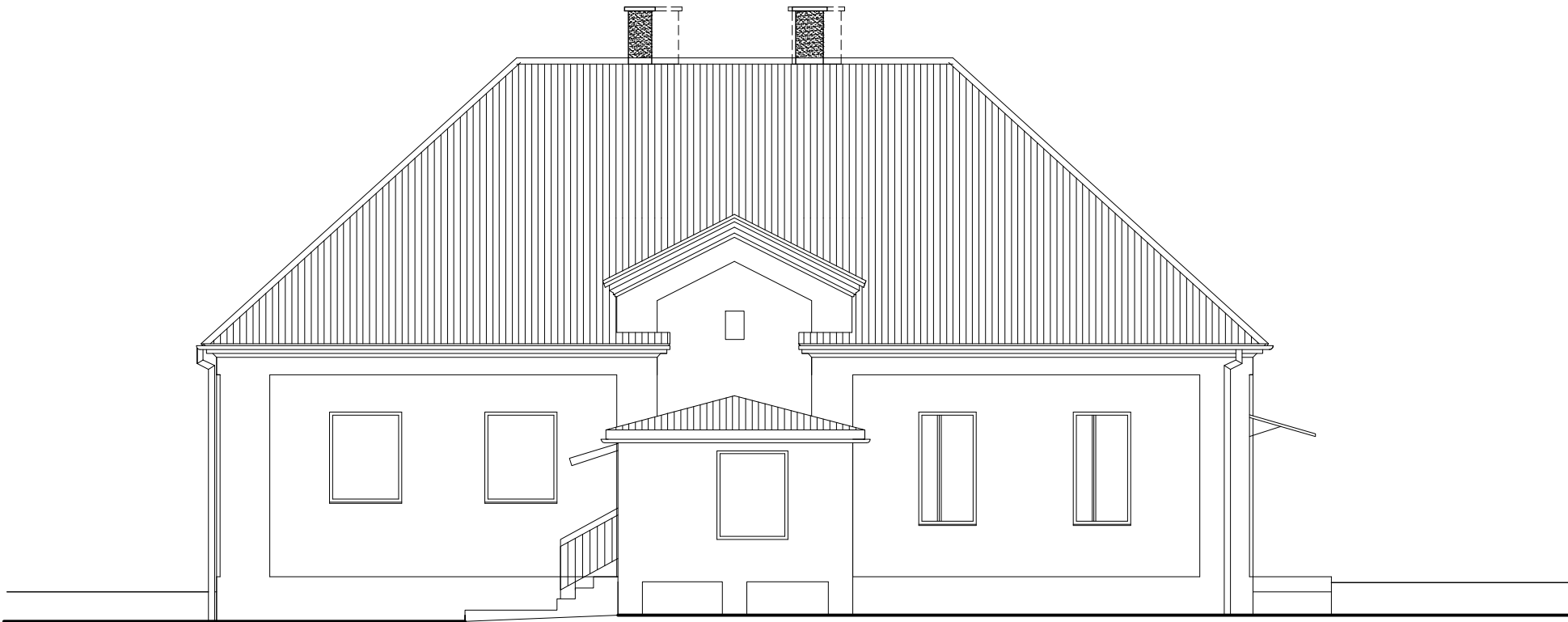
ELEWACJA WSCHODNIA 1: 100