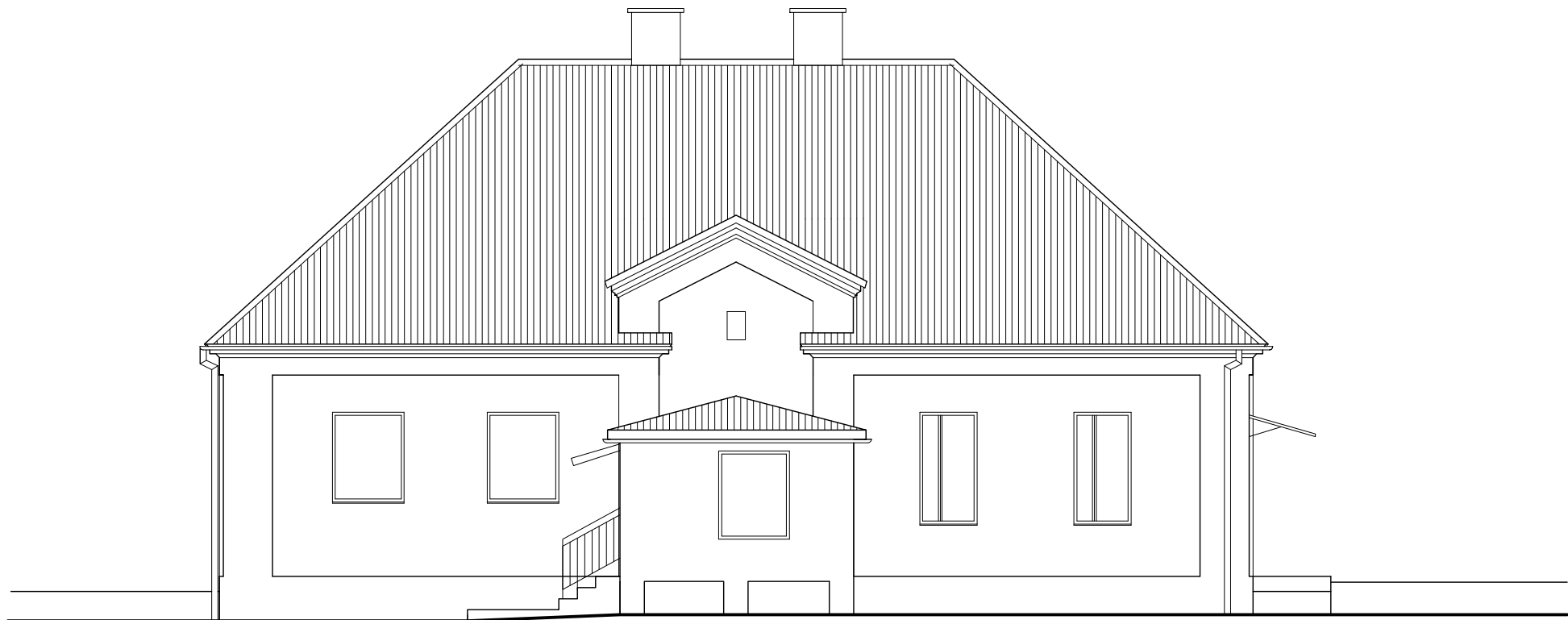
ELEWACJA WSCHODNIA 1: 100