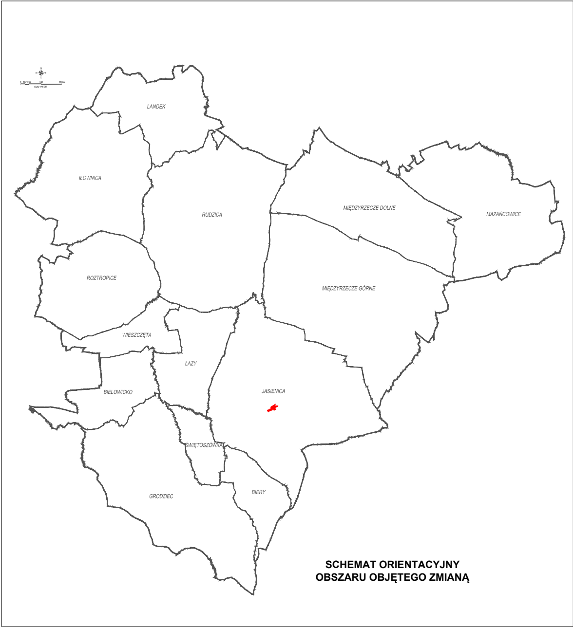
SCHEMAT ORIENTACYJNY OBSZARU OBJĘTEGO ZMIANĄ