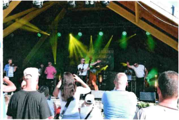
Dożynki Gminne w Rudzicy