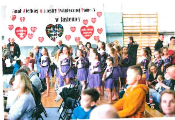
31. Finał Wielkiej Orkiestry Świątecznej Pomocy