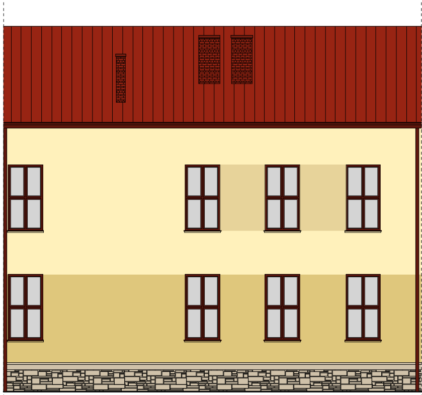
DZIEDZINIEC - WIDOK C-C